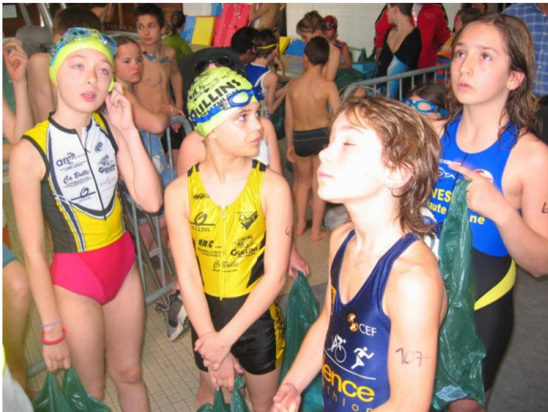
Quelques jeunes pousses plus ou moins attentives au briefing d'avant-course !