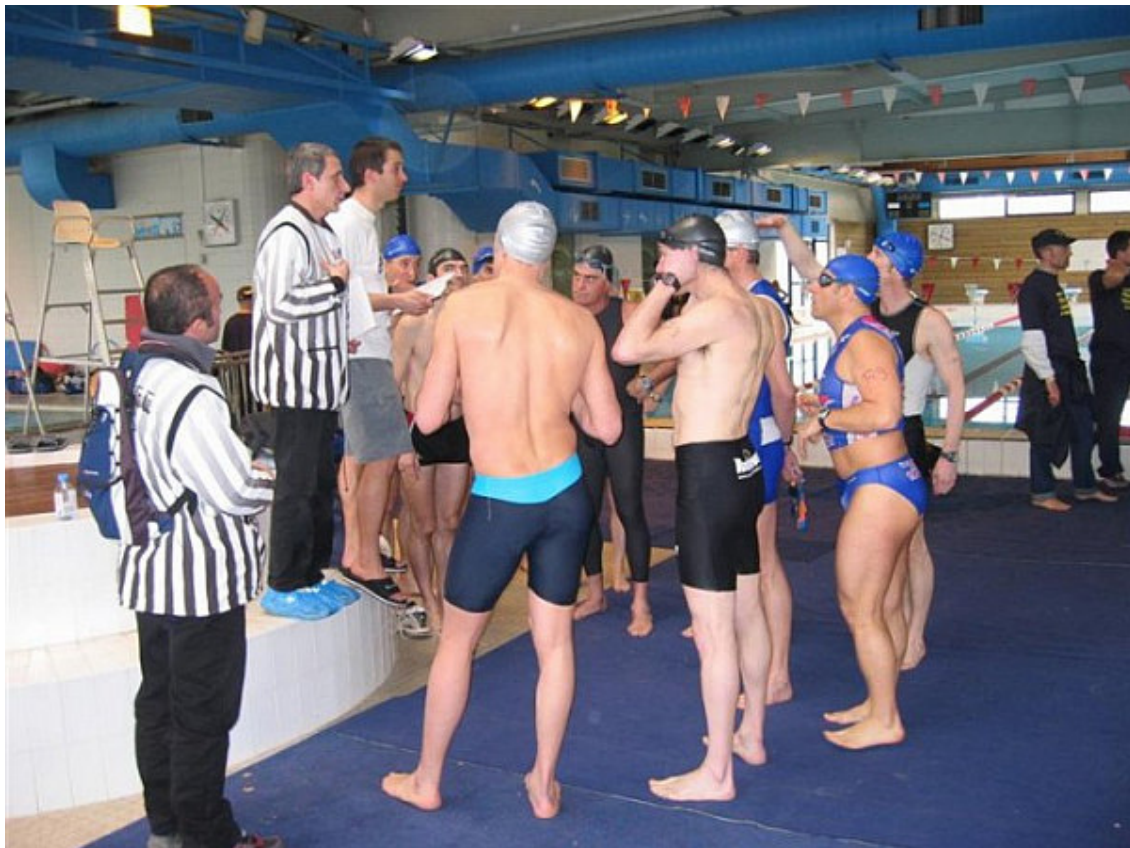
Avant chaque départ, les arbitres fédéraux (chasuble rayée) donnent les consignes de course.