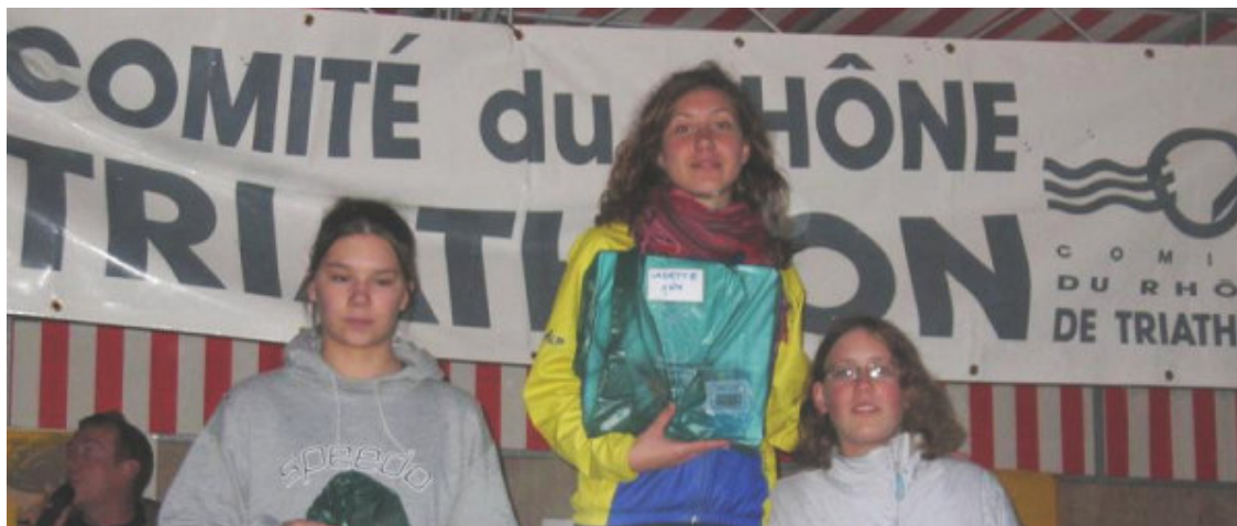
Des aquathlètes récompensées avec le soutien du Comité Départemental du Rhône

Les trois organisations ainsi que le Comité Départemental de Triathlon du Rhône mettent en commun leurs moyens afin de récompenser les aquathlètes ayant participé aux trois épreuves.